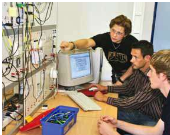
Odborná škola techniky kovů • Elektrotechnika Hannoverského regionu

Symbolický roční poplatek pro certifikovaná školicí centra je stanoven na 500 €, splatný na konci každého roku.